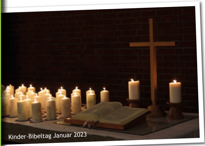
Kinder-Bibeltag Januar 2023