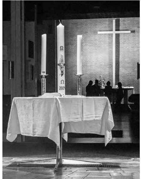
weitere Fotos siehe Umschlagseite 2

Zu diesem Geist und Glaube haben sich auch alle Gläubigen zu ihrer Taufe bekannt. Die Tauerinnerung am Taufbecken erzählt die Auferstehungsgeschichte eines jeden einzelnen: „Gott lässt uns in der Taufe sterben und mit Christus auferstehen; bei der Taufe hat Jesus Christus unser Leben mit seinem Geschick verbunden und uns mitgenommen auf seinen Weg durch den Tod zum Leben.“ , so Habicht. Umso schöner sei es da, sich am Fest der Auferstehung an die eigene, persönliche, kleine Auferstehung zu erinnern.